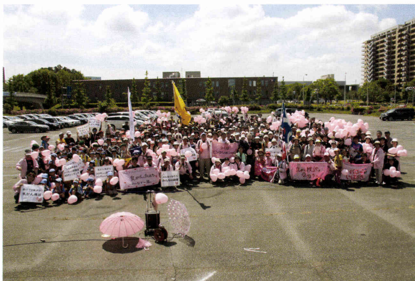
スタート前 みんな揃って